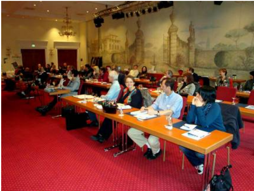
Der großzügig ausgestattete Seminarraum Rossini im Hotel Colosseo Europapark Rust

Das Seminar war eine gelungene Veranstaltung. Das Ambiente war großartig und auch das Essen außerordentlich gut. Man kam sich vor „wie im Urlaub“.